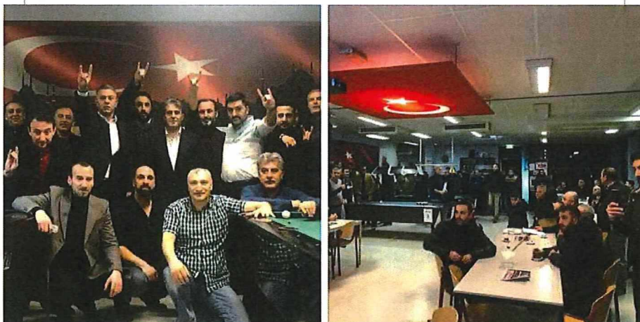
Turkse fascistien uit Hengelo, Almelo en Enschede organiseerden in december 2019 een biljarttoernooi waar massaal het Grijze Wolven-gebaar gemaakt werd.

Hengelo-Almelo-Enschede dernekleri ile ortak düzenlediğimiz ve Teşkilatımızın ev sahipliğinde gerçekleşen 2ci Bilardo Turnuv... Meer weergeven