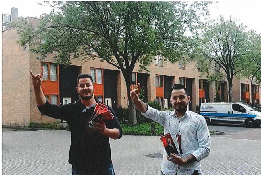
Jongeren van de Turkse Culturele Vereniging Schiedam brengen de Grijze Wolven-groet tijdens uitdelen van verkiezingsmateriaal van de MHP in de aanloop naar de Turkse verkiezingen.

Later dat jaar doet de TCVS nogmaals een beroep op het "wijkbudget bewonersinitiatief". Dit keer voor een bijeenkomst in het wijkcentrum. Men vraagt 570 euro voor "een informatie avond met betrekking tot de verkiezingen in Nederland omtrent de Turken die op 21 oktober t/m 25 oktober in Rotterdam zal plaatsvinden. Het is een situatie wat veel aandacht trekt van de buurtbewoners. Mensen willen meedoen, maar beschikken niet over de informatie hierover." Er zal ook een "erkende gastspreker" aanwezig zijn. De gemeente besluit geen subsidie te geven omdat het "geen wijkactiviteit" is, maar een "politieke bijeenkomst".