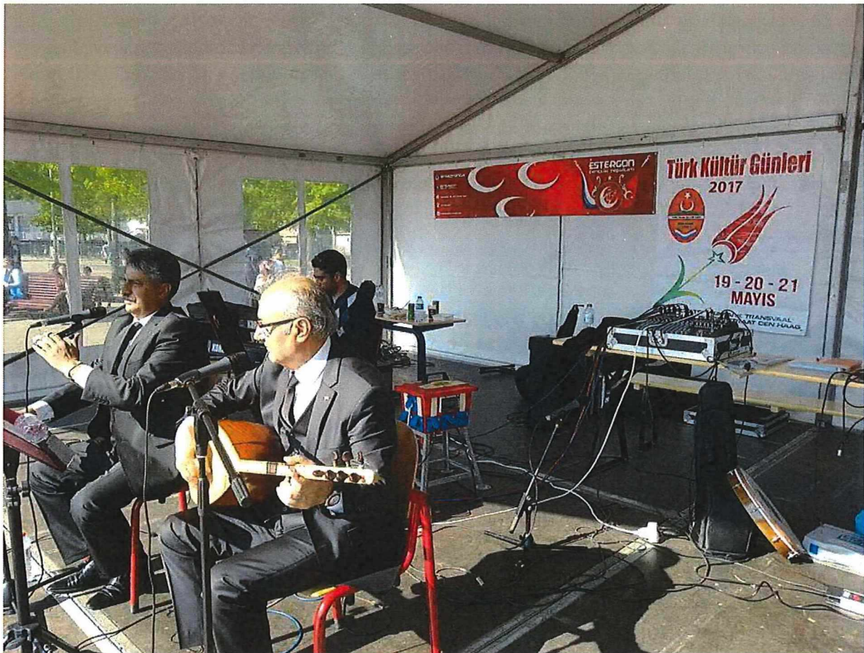
Foto uit het verslag van het Haagse festival van 2017 met het drie manen-spandoek van de Grijze Wolven op het podium.

Uit het verslag komt echter niet naar voren wat er op het propagandafestival te doen was. Het is veeleer een poging om te slijmen met de gemeente: men gaat maar door over "het prettige contact" met de gemeentelijke instanties, dat er professionele en vrijwillige beveiligers aanwezig waren, dat er geen incidenten plaatsvonden, enzovoorts. En natuurlijk dropt men ook het trendy begrip "duurzaamheid" zonder daar enige inhoud aan te geven. Verder geeft men aan dat de "vrouwen tak" Ülkem en de "jongeren tak" Estergon meehielpen. Om een idee te geven: op zowat elke foto op hun Facebook-pagina maken de Estergon-jongens het Turkse Sieg Heil-gebaar. Opmerkelijk was tenslotte dat de oorspronkelijke aanvraag voor een meerdaags festival was, maar dat in het verslag nadrukkelijk en meerdere keren gesproken wordt over één dag: te weten 22 mei. Op basis van dit 'verslag' besluit de gemeente toch alsnog de gevraagde 5.000 euro toe te kennen.