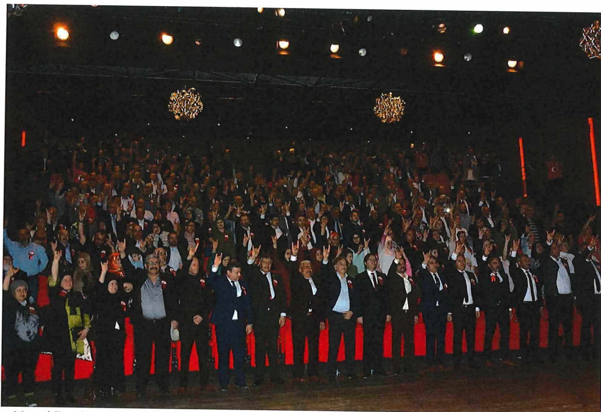
Massabijeenkomst van Grijze Wolven op 8 april 2018 in Nijmegen, ter herdenking van de oprichter van de beweging Alparslan Türkeş (1917-1997).

Een rapport over de (subsidie)relaties tussen Nederlandse gemeenten en Turks extreem-rechts